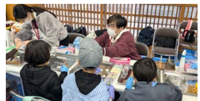
キャンドルづくりを体験する生徒たち