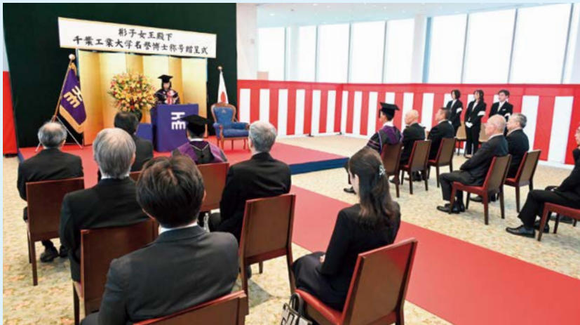
贈呈式でお言葉を述べられる彬子女王殿下

彬子女王殿下の名誉博士の称号贈呈については、11月上旬に報道発表を想定していましたが、三笠宮妃殿下の薨去(11月15日)により発表を延期。12月15日に女王殿下の喪が明けた後、関係機関と改めて検討・調整した結果、12月末の発表となりました。