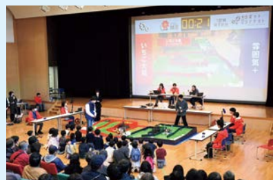
大画面に映し出される名勝負

6号館を中心に行われた屋内イベントでは、今回で28回目になるロボットコンテストや、ゲーム「スーパーマリオメーカー2」や「大乱闘スマッシュブラザーズ」の対戦会など、イベントや展示、演奏、ワークショップなどが行われました。