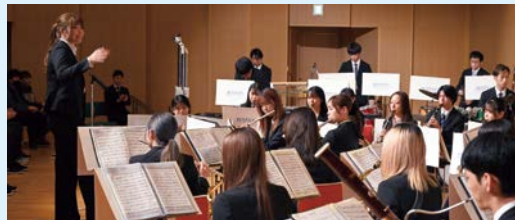
息の合った演奏を披露する吹奏楽部