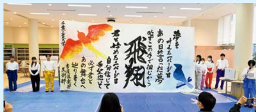
ダイナミックな作品で観客を魅了