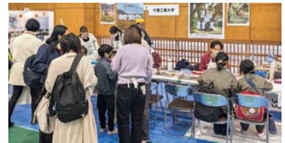
順番待ちに並ぶ参加者

本学は今後も地域の科学啓発イベントへの積極的な参加を通じて、科学の楽しさを広める活動を続けていきます。