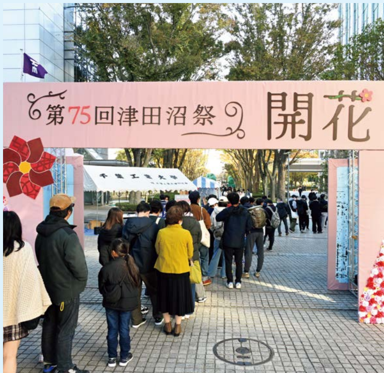
津田沼祭開催！期待に胸ふくらむ来場者の列