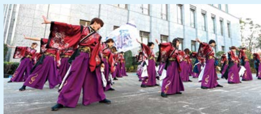
キャンパス内を盛り上げたよさこいソーラン風神部