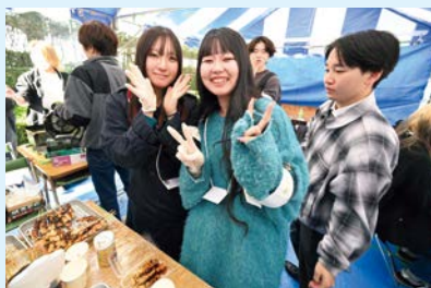
笑顔と美味しさを届ける模擬店ブース

提供する本格派から、もち米を使ったワッフル「もっふる」や、じゃんけんて勝つとギョーザの数が増えたり、10個のギョーザを一番早く食べると無料になったりなどのユニークな企画が盛りだくさんでした。