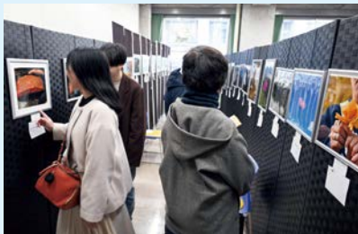
芸術の秋！満載の写真展

今年で75回目となる津田沼祭のテーマは「開花」。実行委員会や参加団体の努力が結実し、来場者に感動を届ける場になること、多様な展示や体験を通じ、来場者が新たな興味や可能性を見いだすきっかけとなること、この2つの思いから「津田沼祭に関わる全ての人の人生が、美しい花のように輝くこと」という願いが込められています。