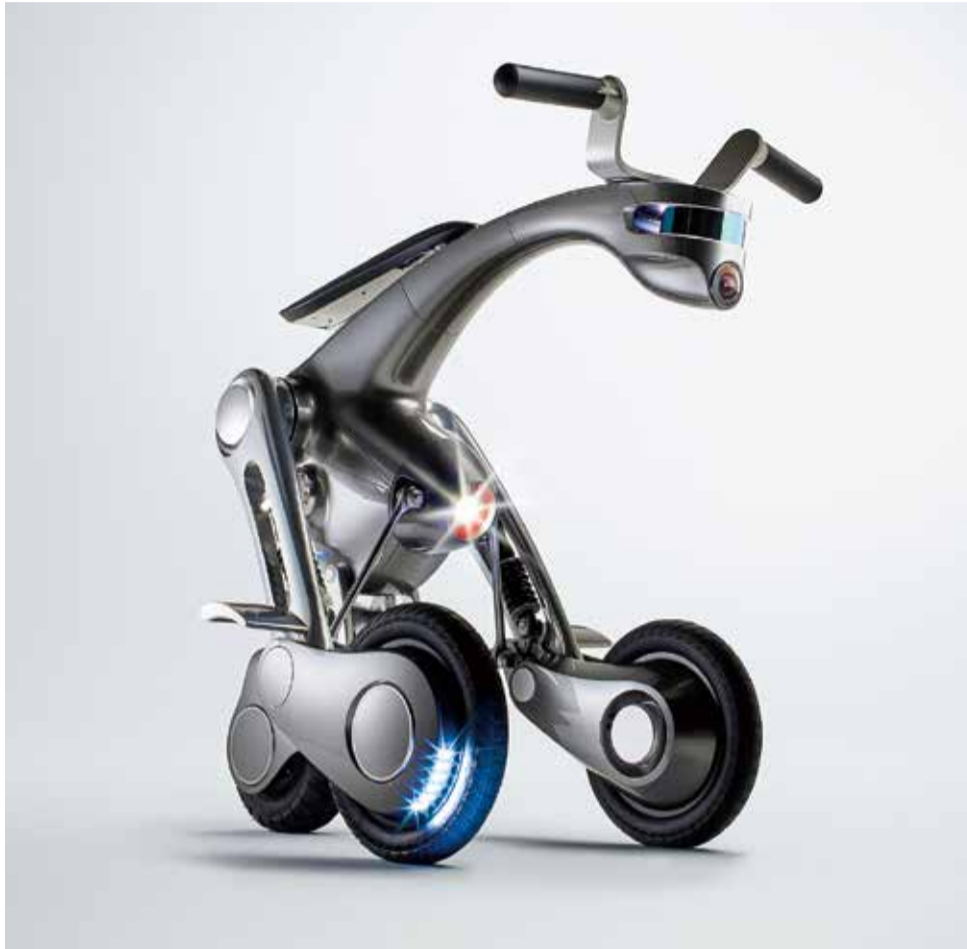
イタリアの国際デザインコンテストでプラチナ賞を受賞したfuRoのCanguRo