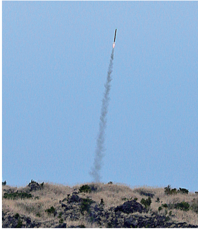
上昇するロケットを見上げ、喜ぶ参加高校生ら