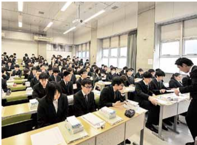
入学式後に開かれたガイダンスで