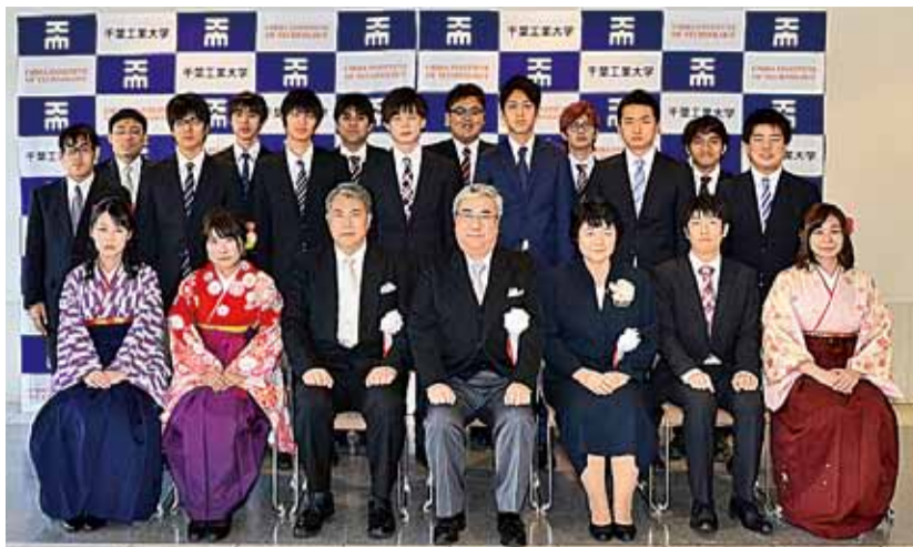
学生表彰受賞者たち。小宮一仁学長(前列中央)とともに