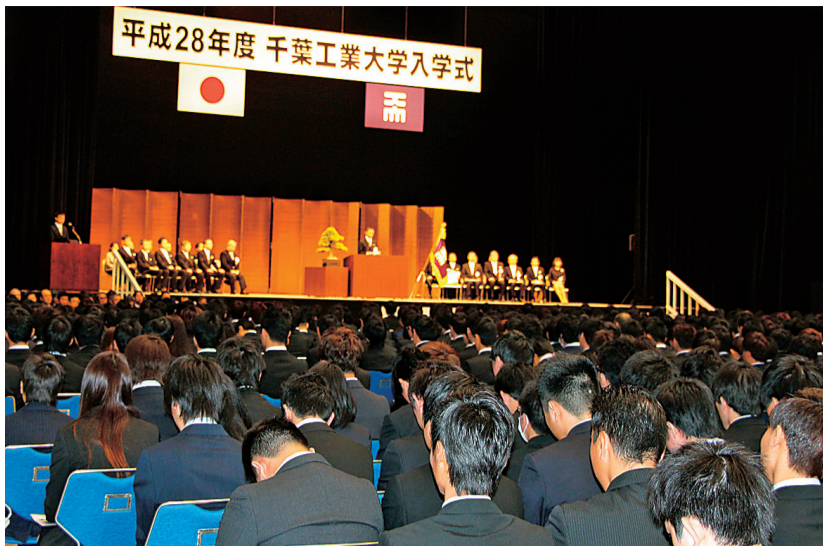
幕張メッセで行われた平成28年度入学式

桜の満開を呼ぶ穏やかな日差しの下、平成28年度の千葉工業大学入学式が4月1日、幕張メッセ（千葉市美浜区）イベントホールで行われた。工学部が専門性を高めた3学部へ改編され、5学部17学科で迎える初めての入学式。多くの保護者に見守られ、学部、大学院合わせて2529人が希望を胸に新たな学生生活へと踏み出した。